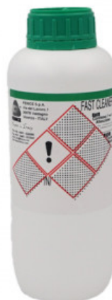
FAST CLEANER DETERGENTE