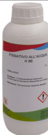
FISSATIVO SEMILUCIDO H 86

R.010-50.0315 FINE OIL H 57 - KG 1 FENICE