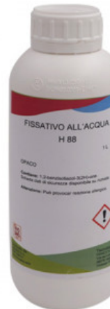
FISSATIVO OPACO H 88

R.010-50.0402 FISSATIVO ALL'ACQUA H 88 OPACO - KG 1 FENICE