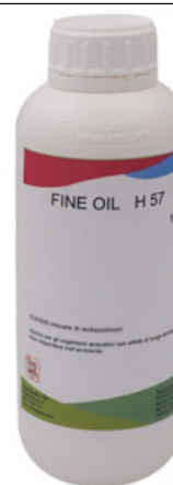
FINE OIL H 57

R.010-50.0104 AQUACOLOR COLORI METAL - GR 250 FENICE