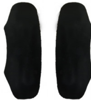
SALVACALZE UOMO CAMOSCIO NERO

S.001-06.103 ALZATACCO RIGIDO BICOMPONENTE GREZZO MM 30