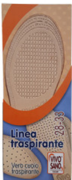
MEZZA SOLETTA VERA PELLE