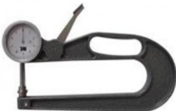
Mod. 4 - 5

R.012-06.002 SPESSIMETRO N.4 - MIS 30 x 200