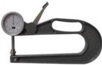
Mod. 4 - 5

R.012-06.001 SPESSIMETRO N.3 - MIS 20 x 50