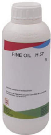
FINE OIL H 57

R.010-50.0100 KIT VERNICI PER RITOCOCCO HP - FENICE