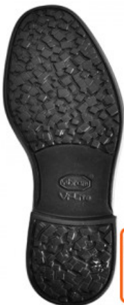
SUOLA SCATTER 0546C

GV.006-38.0001 SUOLA SOFIA 9116 MIS. DA 36 A 41