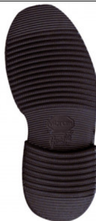
SUOLA LIVERPOOL 2600 47/9

GV.006-01.0001 SUOLA LIVERPOOL 2600 MIS. 35/36 - 37/38 - 39/40