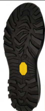
SUOLA 502P LITE WOLF

GV.006-01.0004 SUOLA LIVERPOOL 2600 MIS. 41/42 - 43/44 - 45/46