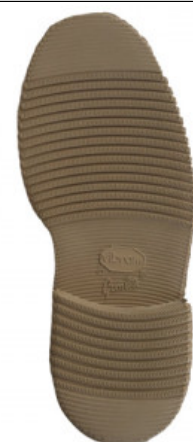
SUOLA 2600 LIVERPOOL 41/2 - 43/4 - 45/6 BEIGE

GV.006-41.0009 SUOLA LITE WOLF 502P DAL 36.5 AL 48.5