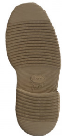
SUOLA 2600 LIVERPOOL 35/6 - 37/8 - 39/0 BEIGE

GV.006-01.0007 SUOLA LIVERPOOL 2600 MIS. 47/49