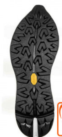
SUOLA SPHIKE 186C

GV.006-39.0001 SUOLA SCATTER 0546C MIS. DA 38 A 44