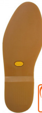
SUOLA PORTOCERVO 2303

GV.006-01.0001A SUOLA LIVERPOOL 2600 MIS. 35/36 - 37/38 - 39/40 BEIGE