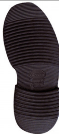
SUOLA LIVERPOOL 2600 41/2 - 43/4 - 45/6

GOMMA / VIBRAM / SUOLA CITTA' E ORTOPEDIA