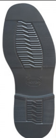
SUOLA LIENZ 2094

GOMMA / VIBRAM / SUOLA CITTA' E ORTOPEDIA