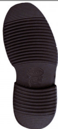
SUOLA LIVERPOOL 2600 35/6 - 37/8 - 39/0

GV.006-01.0004A SUOLA LIVERPOOL 2600 MIS. 41/42 - 43/44 - 45/46 BEIGE