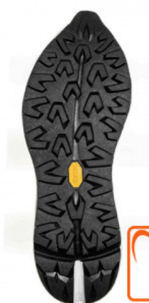
SUOLA SPHIKE 186C

GV.006-39.0001 SUOLA SCATTER 0546C MIS. DA 38 A 44