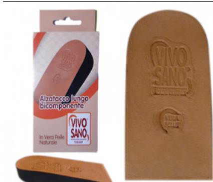
ALZATACCO BICOMPONENTE RIGIDO VERA PELLE mm 20