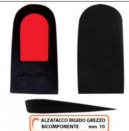
ALZATACCO RIGIDO GREZZO BICOMPONENTE mm 10