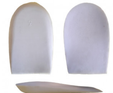
ALZATACCO GREZZO CONFORTEVOLE

S.008-00.103 ALZATACCO RIGIDO BICOMPONENTE VERA PELLE MM 30