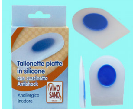
TALLONETTA PIATTA IN SILICONE CON ANTISHOCK

S.008-00.102 ALZATACCO RIGIDO BICOMPONENTE VERA PELLE MM 25