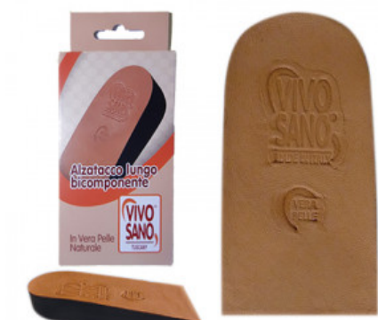
ALZATACCO BICOMPONENTE RIGIDO VERA PELLE mm 25

S.012-01.002 TALLONETTA AVVOLGENTE IN GEL