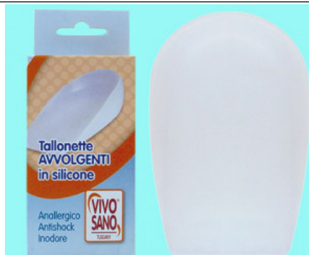
AVVOLGENTE IN GEL

S.008-00.101 ALZATACCO RIGIDO BICOMPONENTE VERA PELLE MM 20