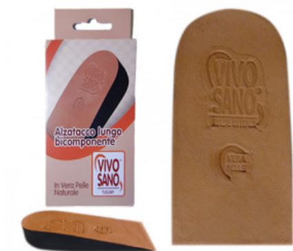
ALZATACCO BICOMPONENTE RIGIDO VERA PELLE mm 30

S.012-01.001 TALLONETTA PIATTA IN GEL CON ANTISHOCK