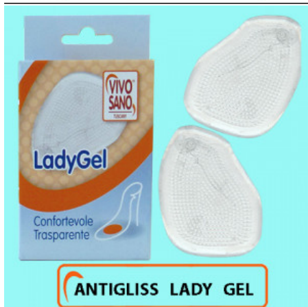
ANTIGLISS LADY GEL

S.001-06.000 ALZATACCO CONFORTEVOLE GREZZO